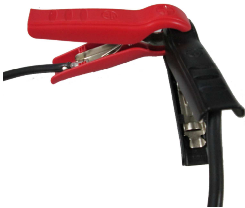
Abbildung 3: Ladezangen im Kurzschluss

Soll die Kabelkompensation wiederholt werden, kann die Messung in der Betriebsart Kabelkompensation durch Drücken der START-Taste erneut durchgeführt werden.